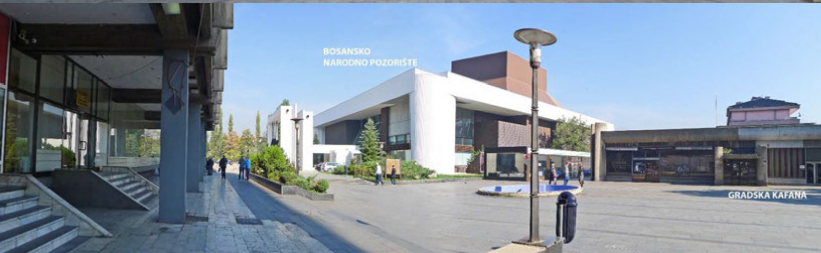
Slike 7-8-9: Školska ulica sa nazivima objekata