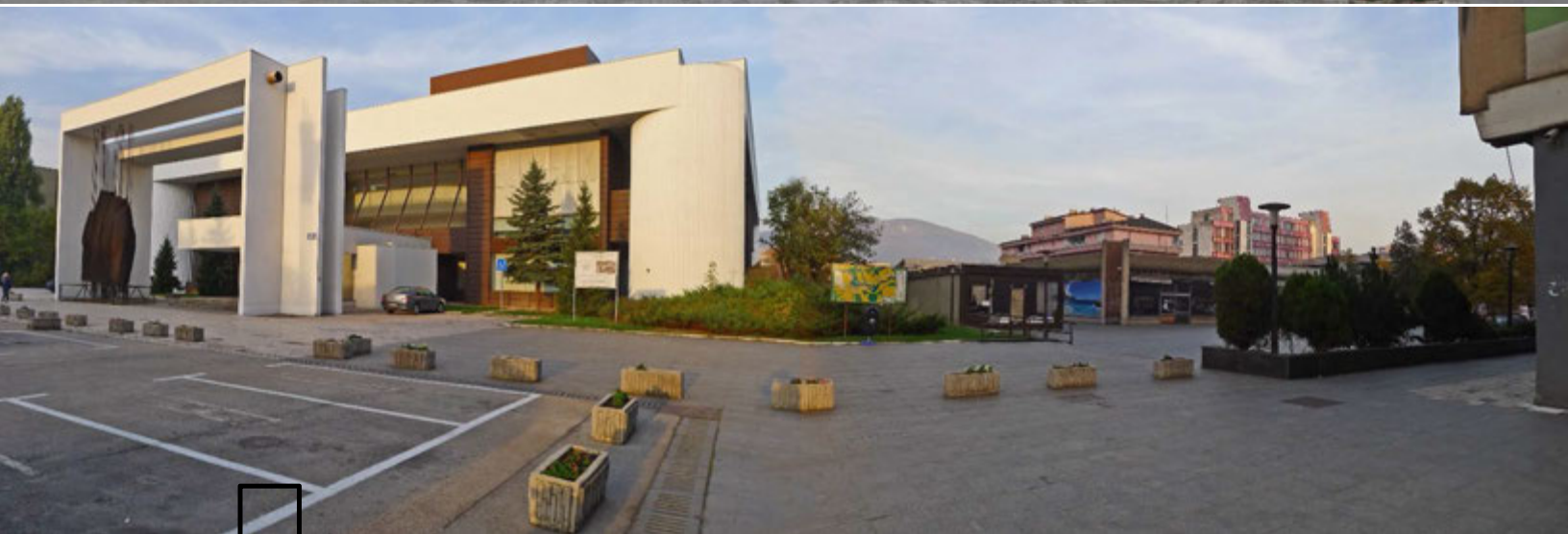
Slike 11-12: Bosansko narodno pozorište

Pored odnosa prema starom i novom objektu zgrade Gradskog suda, zgradi ASA banke, objektu Gradske kafane, trenutnog objekta Gradske uprave, prostornog i programskog karaktera Školske ulice (u kojoj se nalaze objekti kao što je Gradska biblioteka, Muzička škola, javni Vrtić „Dunja“ i sl.), prostora starog Gradskog parka koji se nalazi u neposrednoj blizini (sa druge strane Školske ulice), učesnici Konkursa izričito moraju voditi računa o odnosu koji njihovo rješenje uspostavlja sa zgradom Bosanskog narodnog pozorišta , djelom arhitekata Jahiela Fincija i Zlatka Ugljena, koje je 1978. godine osvojilo prestižnu Saveznu Borbinu nagradu za arhitekturu. Novoprojektovani prostor mora uspostavljati komplementaran odnos za najvažnijim objektom kulture u gradu (Bosansko narodno pozorište) i svi pokušaji uspostavljanja konkurentnog, pretencioznog i nametljivog odnosa prema okolini će biti smatrani neprimjerenim.