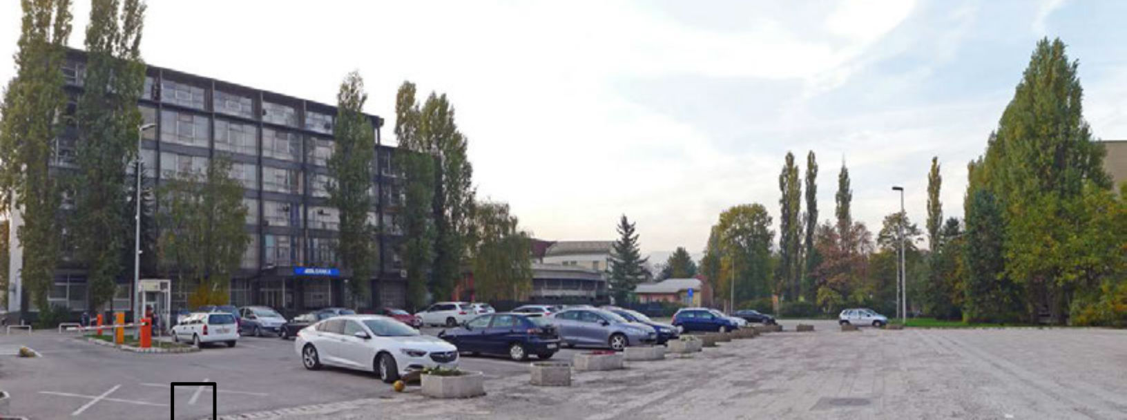
Slika 3: Pogled na lokaciju sa juga