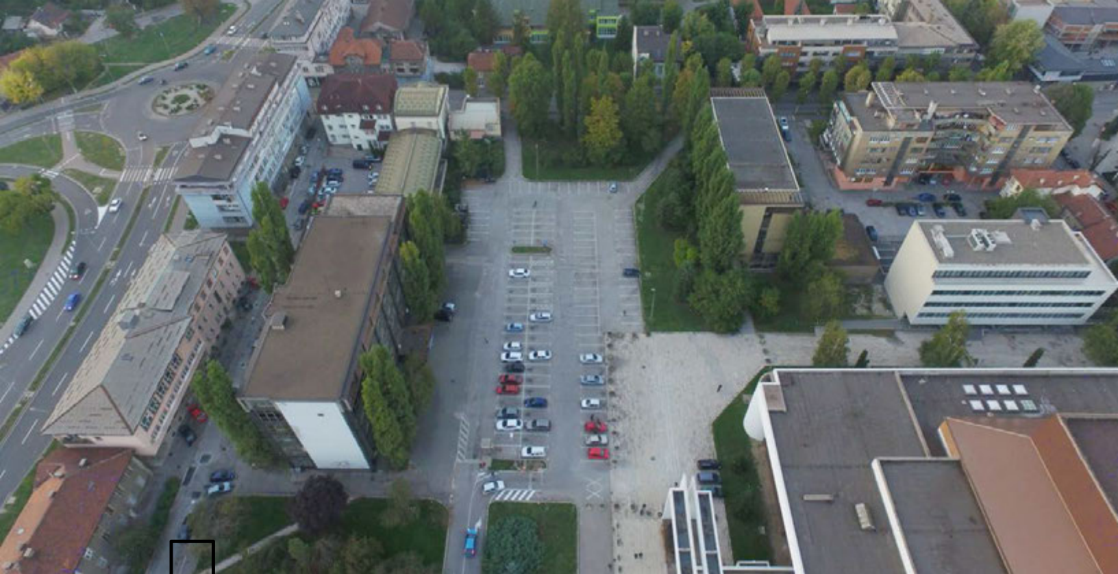
Slike 10: Pogled na užu lokaciju uz zraka