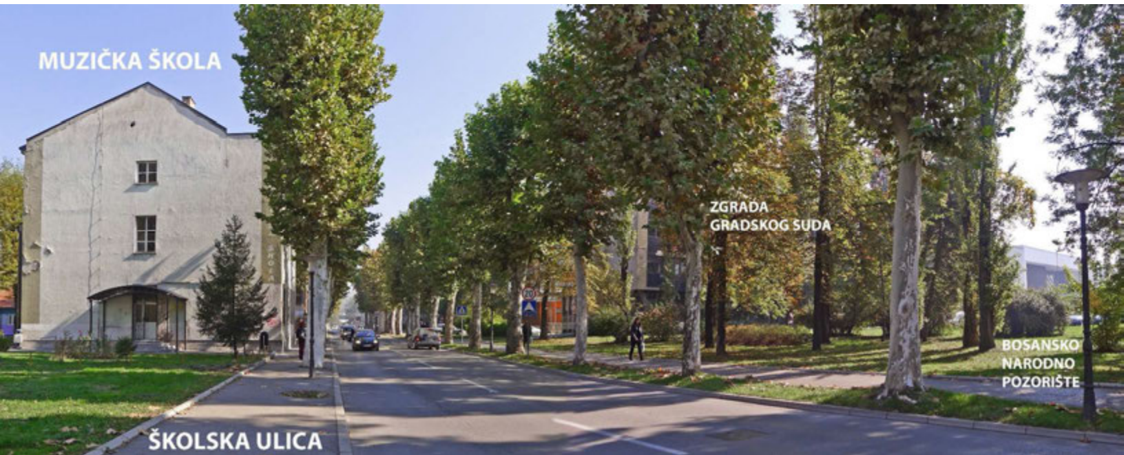
Slike 4-5-6: Školska ulica sa nazivima objekata