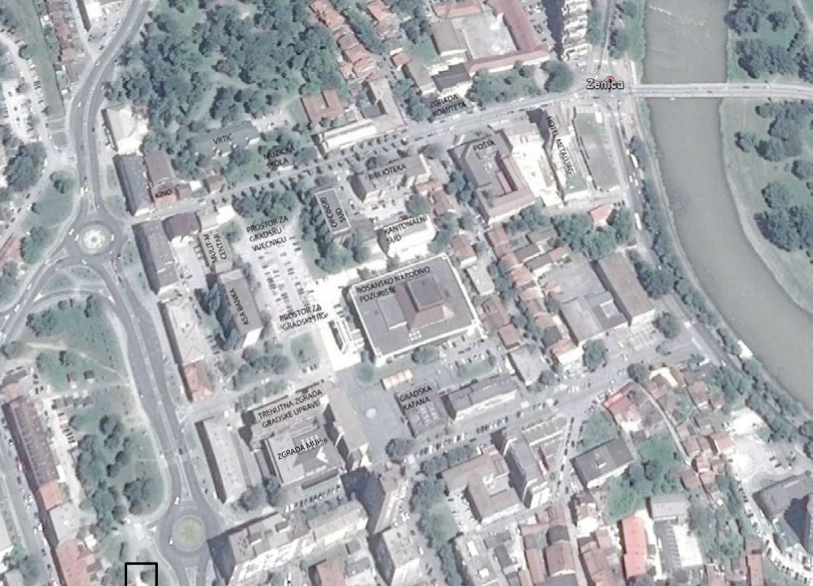
Slika 3: Orto-fotografija uže lokacije sa nazivima objekata

Lokacija se nalazi u direktnom kontaktu sa ulicama „Školska ulica“ i ulica „Sestara Ditrjih“, te u indirektnom kontaktu sa Masarykovom ulicom (bitna pješačko-kolska ulica u gradu), ulicom Safvet- bega Bašagića, te ulicom Branilaca Bosne (glavnom prometnom ulicom).