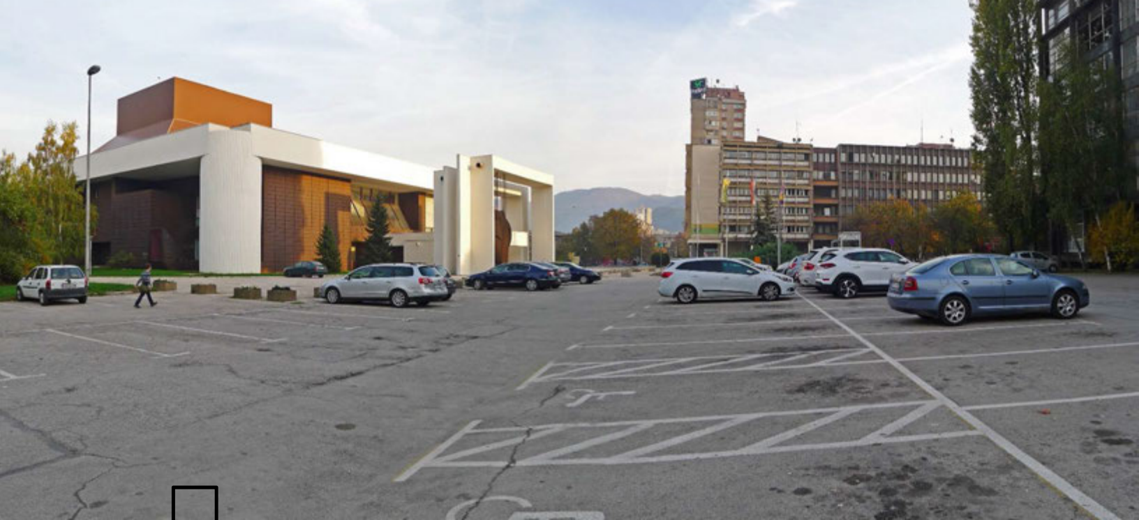
Slika 1: pogled prema objektu i trgu Bosanskog narodnog pozorišta